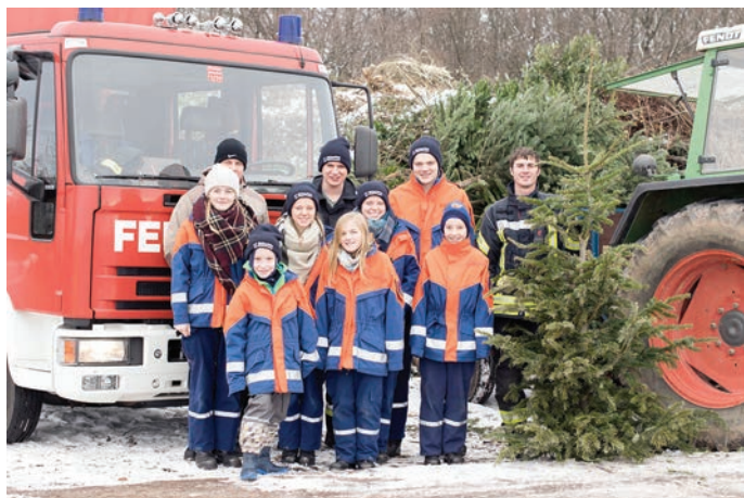
Gruppenbild nach der erfolgreichen Christbaumsammlung 2017.

Gegen Abend wird die Band „Right Moments“ aus Gräfenhausen wieder für Stimmung sorgen, dies sollten Sie sich nicht entgehen lassen! Wir freuen uns auf Ihren Besuch.